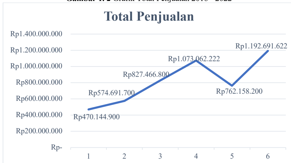
Gambar 1. 2 Grafik Total Penjualan 2016 - 2022

Mie XYZ merupakan salah satu restoran di Bali yang menjual berbagai menu dengan bahan utama mi dengan harga yang sangat terjangkau dan banyak varian menunya. Mie XYZ menawarkan menu-menu yang beragam dan tempat yang nyaman dengan tema yang menarik. Sehingga banyak pelanggan yang rela antre untuk menikmati Mie XYZ dan tidak sedikit pula yang memakai jasa driver online agar tidak antre untuk membeli Mie XYZ.