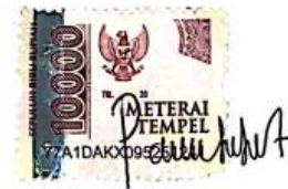
Putrie Arlidjah Cita