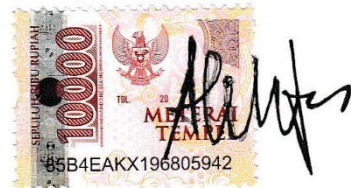
Alchintia Putri Wahyudi