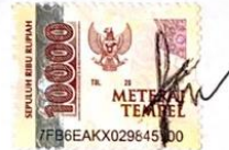
Fadila Reza Aprilia