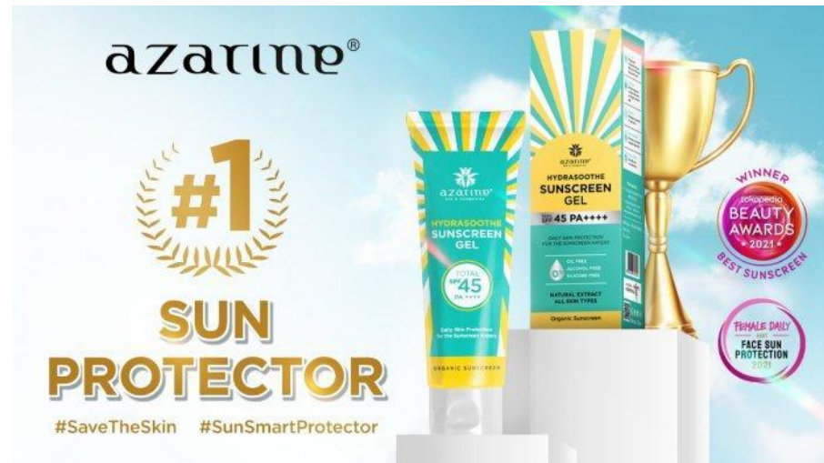
Gambar 5. Penghargaan Azarine Hydrasoothe Sunscreen