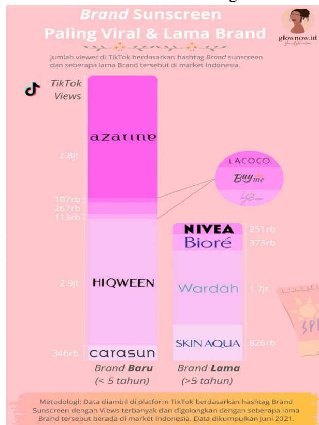
Gambar 3. Data Brand Sunscreen Paling Viral &amp; Lama Brand

Meskipun produk Azarine viral di media sosial, data Google Trends pada Gambar 2 di atas menunjukkan bahwa Azarine masih menempati urutan keempat di bawah Somethinc yang baru saja merilis produk sunscreen di tahun 2022. Hal tersebut menunjukkan Azarine masih kalah bersaing dengan produk skincare lokal lainnya.