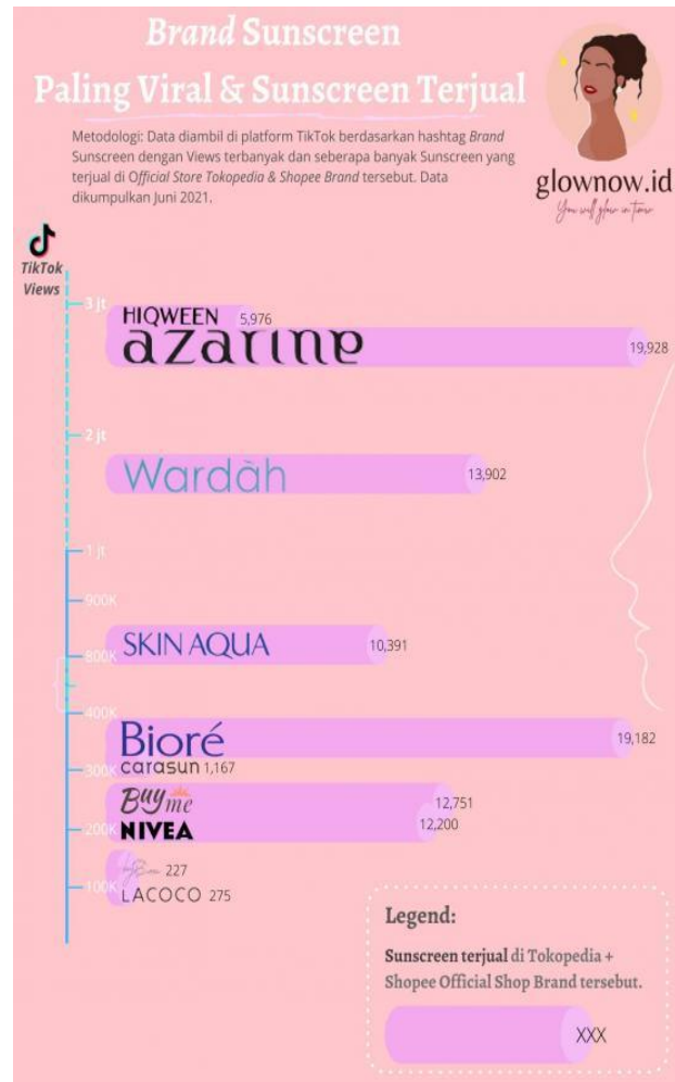
Gambar 4. Data Brand Sunscreen Paling Viral & Sunscreen Terjual

standar kadar SPF yang dibutuhkan rata-rata orang Indonesia, yaitu SPF 20-30 menurut dr. Adeline Jaclyn dalam artikel yang ditulis pada klikdokter.com (2022).