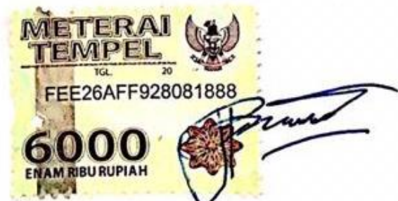
Afrio Rizqi Wigiarto