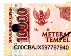
Zharfa Shafiera Salsabila