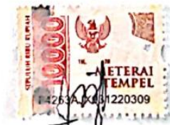
Silva Ria Dinasty