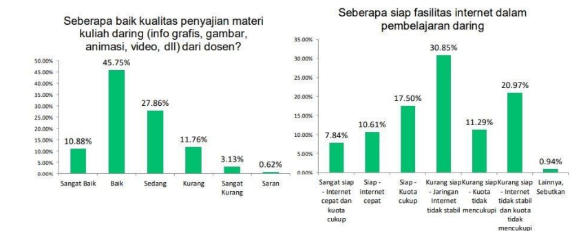
Gambar 2. Kualitas Penyajian & Fasilitas